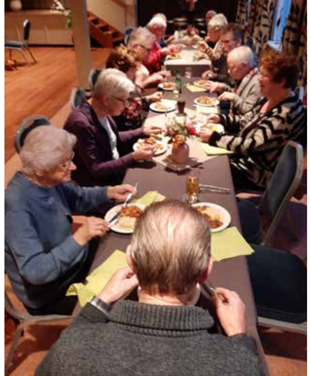
De senioren genieten van een heerlijk stamppotbuffet van HarmKookt.